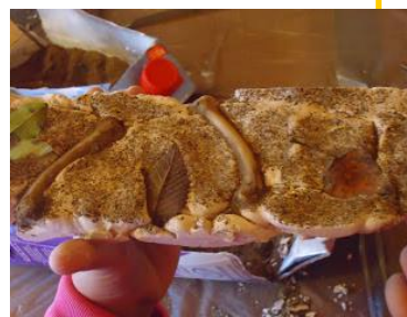
Texto y fotos: Nahia Villanueva (CI Foces)