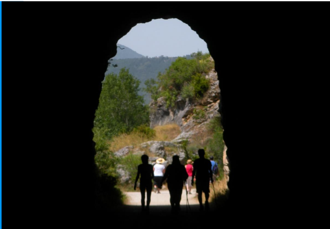
Camino Natural de del Irati.

SUSCRIPCIONES: cinlumbi@navarra.es 948 88 08 74