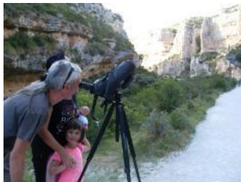
Observación de aves con telescopio. Autor: Andrea Sorli

Las actividades organizadas durante este verano han tenido muy buena acogida entre los visitantes y la población local. Durante los meses de julio y agosto se organizaron observaciones de aves en las foces de Arbaiun y Lumbier, visitas guiadas al Centro de Interpretación, visitas guiadas a la Foz de Benasa (organizada por el CIN de Ochagavía), y se ha dado servicio de alquiler de prismáticos. Se trata de actividades que llevan ya varios años en funcionamiento y que invitan a los visitantes de las foces a conocer mejor a las aves que las habitan y descubrir los valores de estos Espacios Naturales.