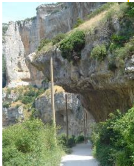
El Camino Natural del Irati a su paso por la Foz de Lumbier (Reserva Natural) Autor: ML Ilundain