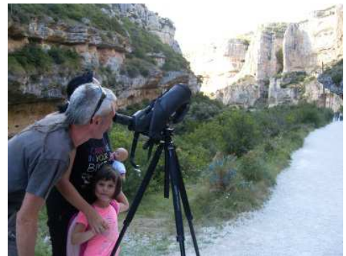
Hegaztiei teleskopioz behatzen. Egilea: Andrea Sorli

Bisitariek eta bertako jendeak oso harrera ona egin diete udan antolatu diren jarduerari. Uztailean eta abuztuan honako hauek antolatu dira: hegazti behaketak Arbaiungo eta Irunberriko arroiletan, bisita gidatuak Interpretazio Zentrora, bisita gidatuak Benasako arroilara (Otsagabiko Naturaren Interpretazio Zentroak antolatua) eta prismatikoak alokatzeko zerbitzua eman da. Badira urte batzuk jarduera horiek abian daudela; haien bidez, gonbit egiten zaie arroiletako bisitariei bertan bizi diren hegaztiak hobeki ezagutzera eta naturagune horien balioak deskubritzera.