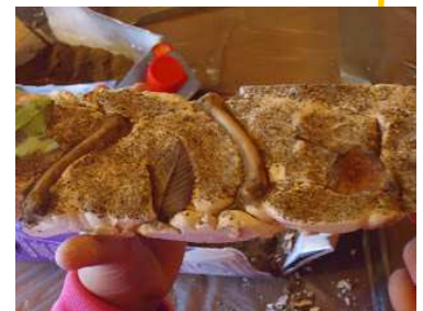
Testu eta argazkiak: Nahia Villanueva (Arroilen IZ)