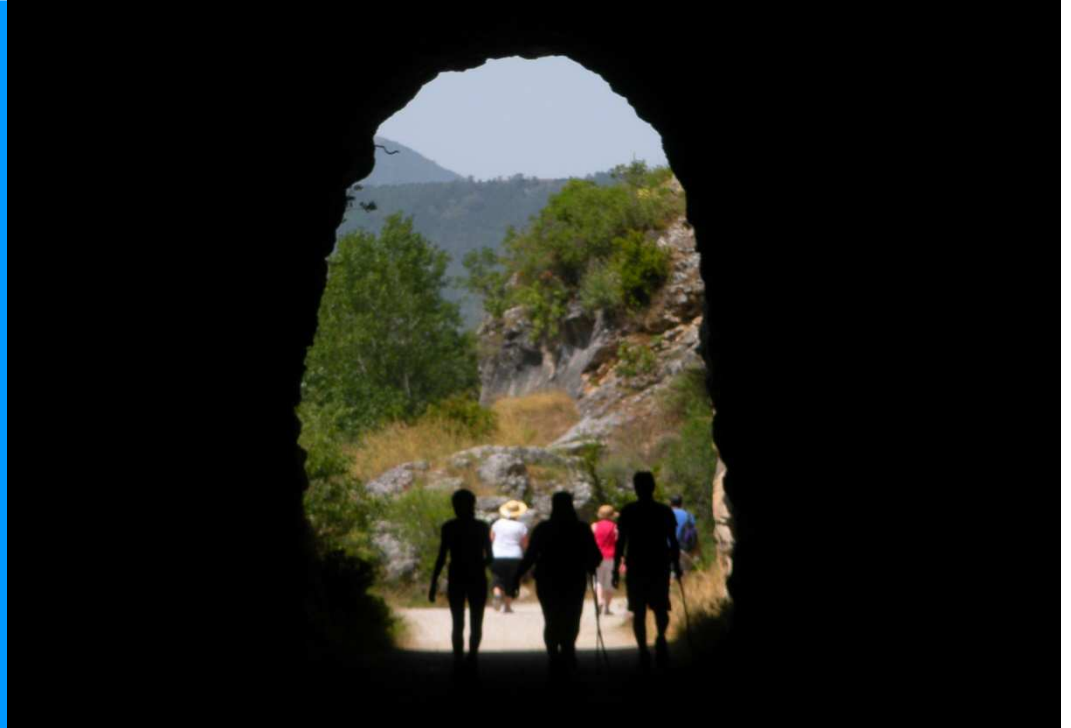
Iratiren Natur Bidea. Egilea: ML Ilundain