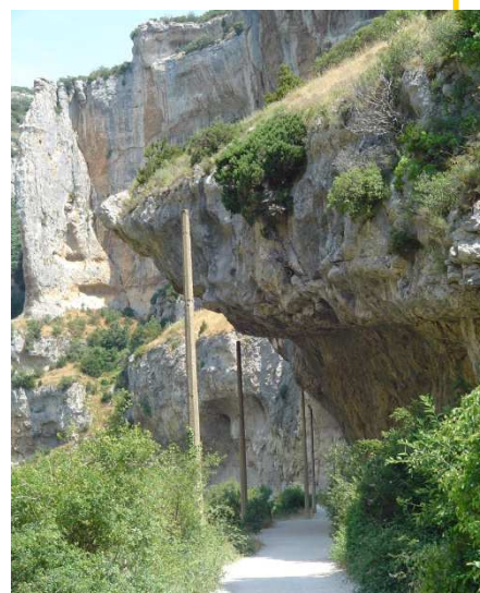
Iratiren Natur Bidea Irunberriko arrolan (Natur Erreserba) Egilea: ML Ilundain